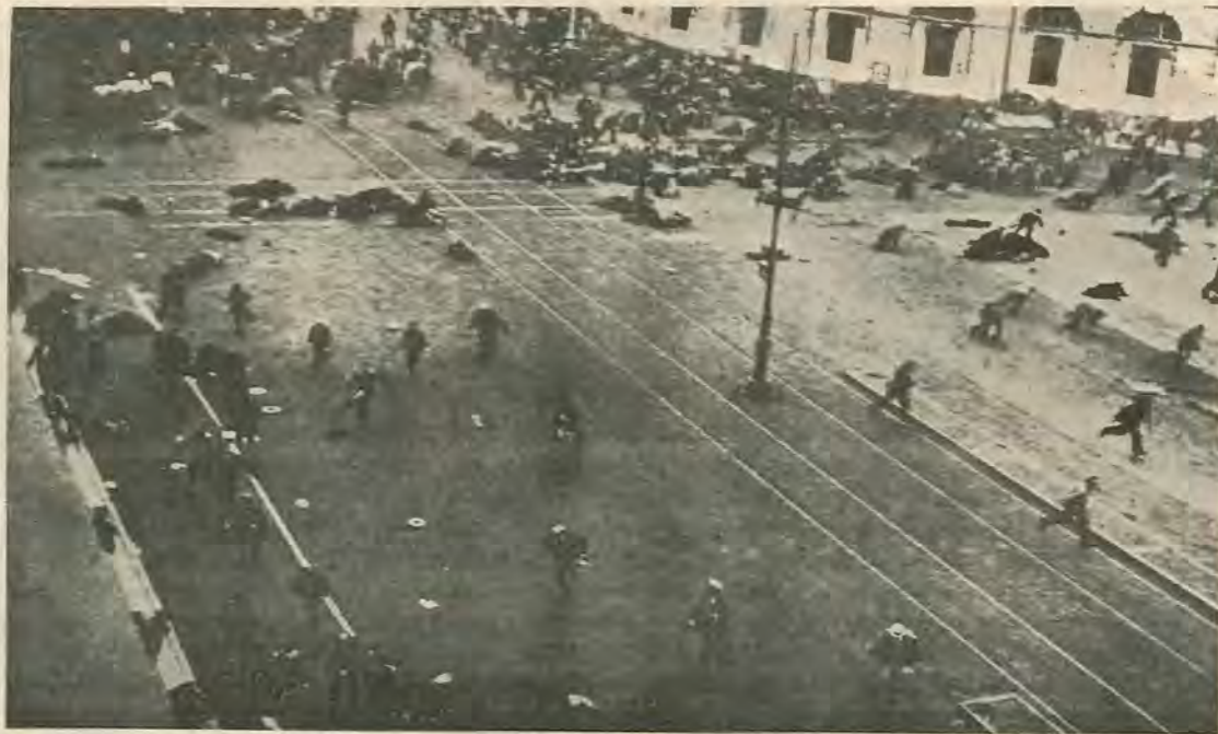
Οι μέρες του Ιούλη. Διαδηλωτές πυροβολούνται.

...Στό μεταξύ ο Λένιν έλεγε: «Οι ίδιες οι καταπιεσμένες μάζες θα φτιάξουν την κυβέρνηση τους...»